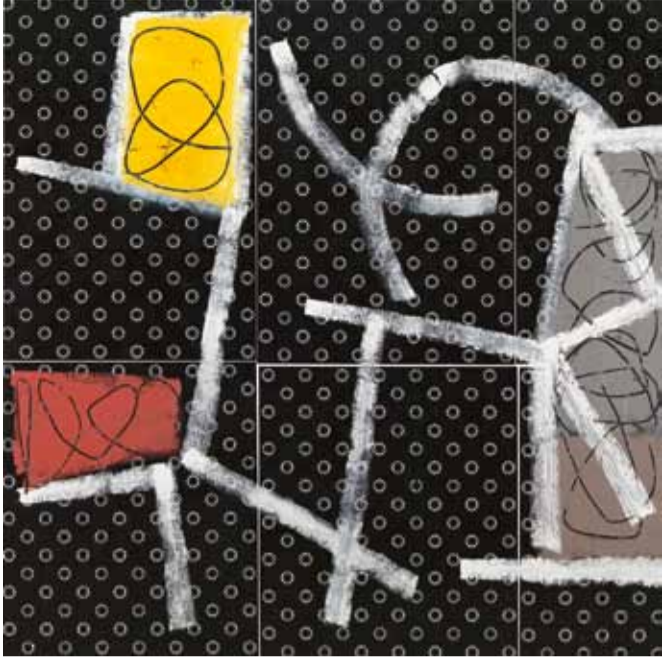
13 11 21, huile sur toile, 190 x 190 cm