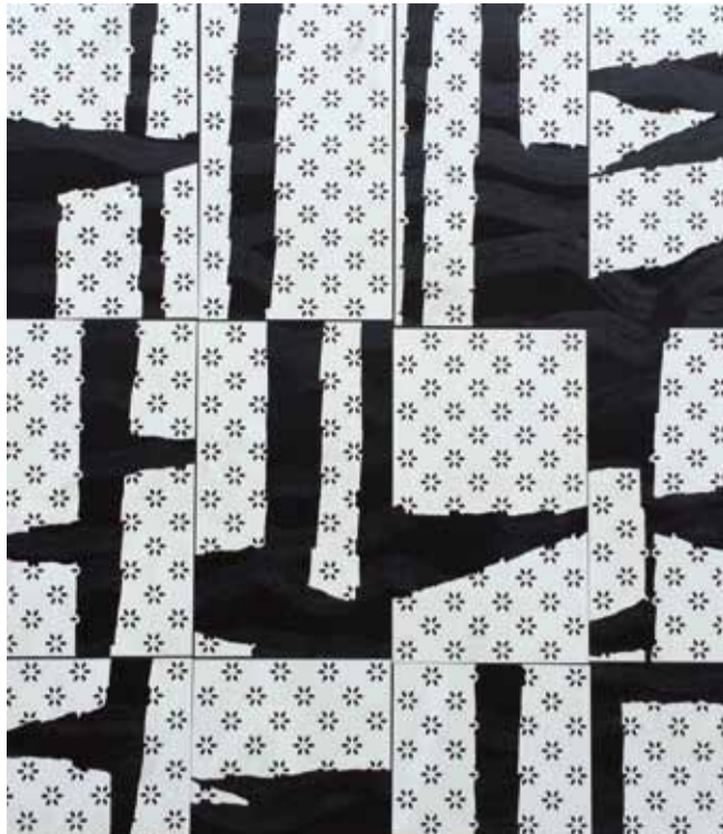
14 05 24, huile sur toile, 230 x 195 cm

(* Zurstrassen gebruikt als titel van zijn werk de datum waarop het werd vervaardigd.