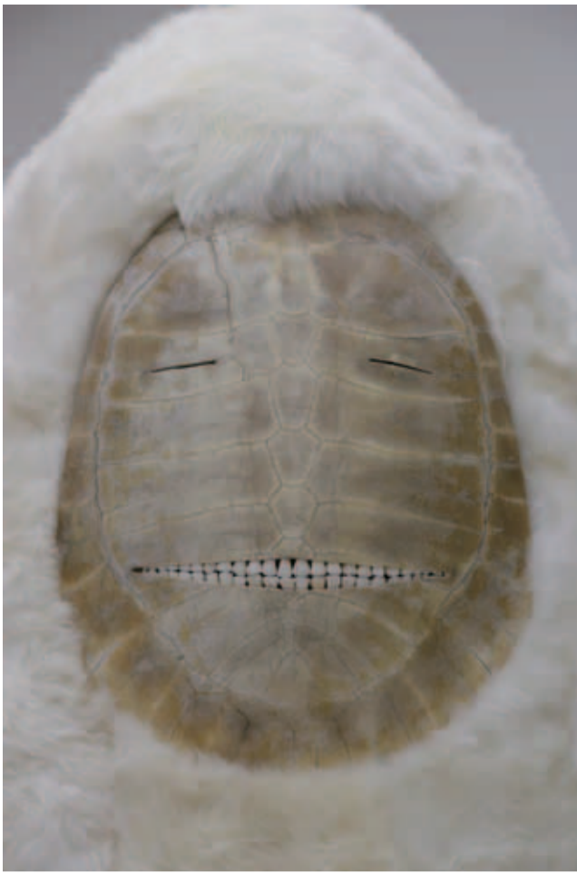
Dersou, 2008 - Peau de mouton, bois, carapace de tortue, dents de cheval, bottes et gants en cuir.