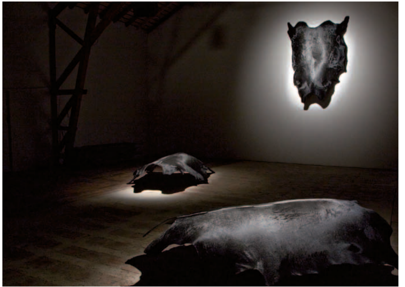
Black Skins, 2009 - Peaux de vaches noires, résine époxy, fibre de verre. 290 x 217 x 60 cm chacune

De indrukwekkende aanwezigheid van Dersou , een totem waarvan het aangezicht bedekt is met het schild van een schildpad en dat met schapenvellen is omgord, heet ons welkom op de drempel van het heden